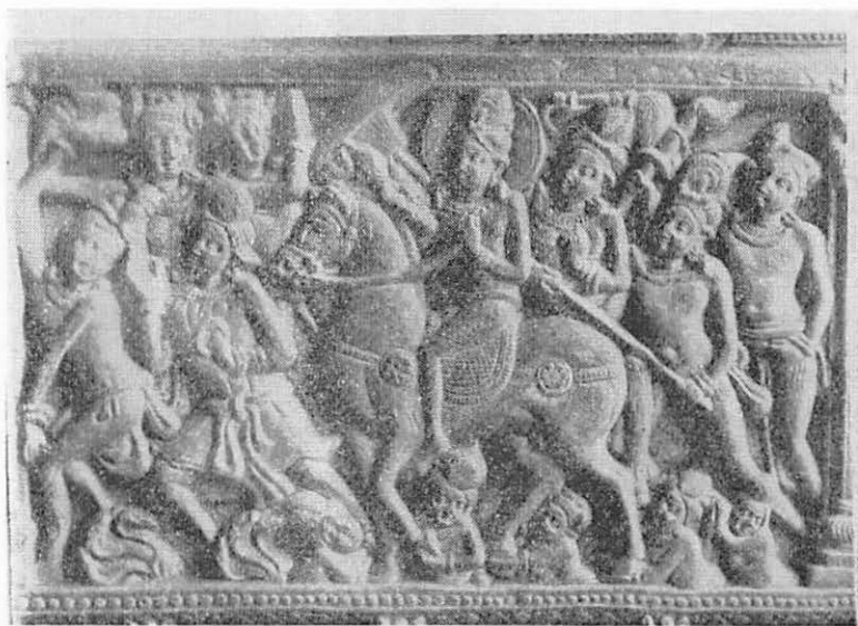
1 四天夜叉が捧げる（ナガルジュナコンダ出土）

以上の經典の叙述のように、「四天王や無量乾闥婆衆鳩槃荼衆、又無量百千の諸夜叉」が、カンタカの足をもちあげて虚空中を行くとあるが、私が注目したいのは、ガンダーラをはじめA・D三、四世紀の彫刻中のこの場面である。特に、写真1の彫刻中の四天、及び夜叉は「大地から半身を出して」馬の足をかつき、又、捧げ持っている。これは他の人物とのつり合い、馬を余り高