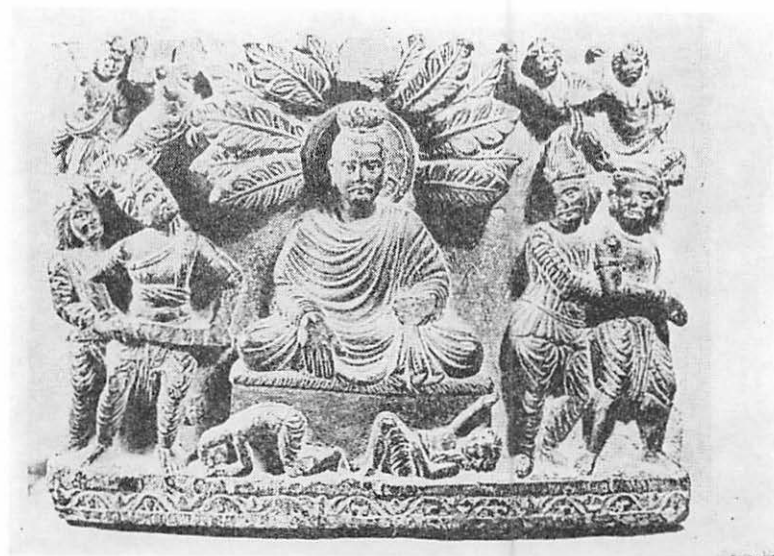
3 触地印（ペンシャワル博物館蔵）