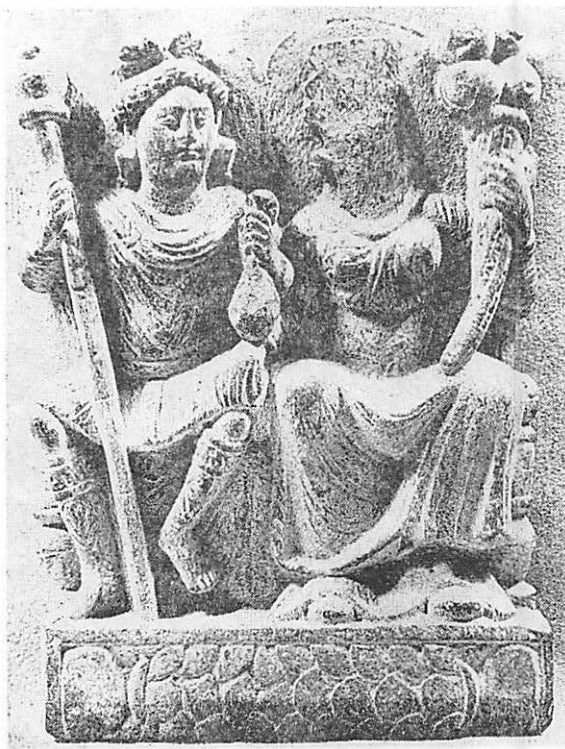
5 ハリティーとパンティカ (ペンジャワル博物館)

仏教の神としてとり入れられた鬼子母神も、もともとは、ペルシャの地母神であったことは前述した。彼女がもつザクロは、砂漠地帯の果物であり、その種は、内に何万と包まれている。まさに豊穰そのものを表しているよう。豊穰といえど彼女の持つコルヌコピヤ、即ち切口から木の芽が萌え出ている動物の角、これこそ生命力、生産力以外の何ものでもない。