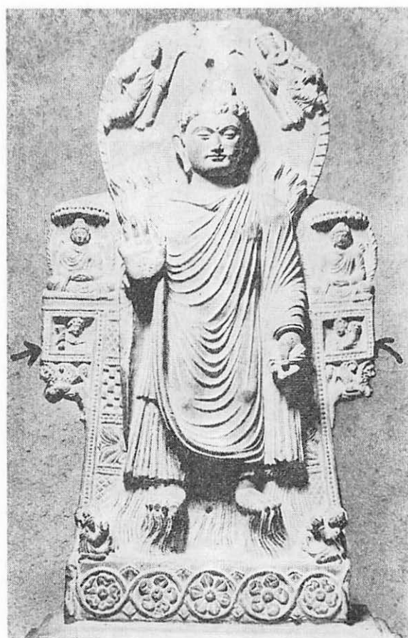
6 双神変像（パリ、ギメー博物館）

パクトリヤ・サカ・パルタイ、そしてクシャンと、異邦人の侵入統治によって、ペーダ以来のカースト制度が乱れ、実力のあるものが社会の上位につく風潮が、クシャンの世界で起った。社会の下位に甘んじていた農民は、その生産力によって、又商人も、シルクロードの通商によって、巨利を得れば、社会の上層に行く。この為、生産の神ハリティーと、財宝の神パンティカの信仰が仏像成立前、西紀後・二世紀に爆発的に信仰されたことが、無数に残るハリティーとパンティカ像によって知られる。写真5は、仏教的脚色を経た鬼子母神神話以前のものである。即ちハリ